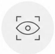
Imagen de alta definición