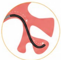
Punta Flexible en Forma de S

Ángulo de flexión \geq 260^\circ con láser y vaina, alta flexibilidad para un fácil acceso a todos los cálices renales.