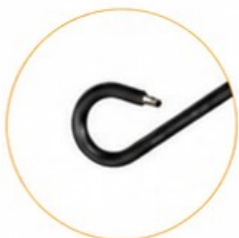
Fuerte Fuerza de Tracción