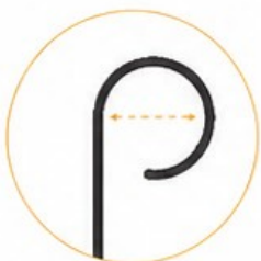
Radio de Flexión Ultrapequeño