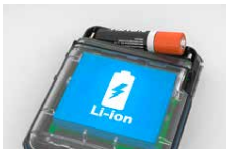
Sistema de doble batería ecológica (ilustración)

Gracias al sistema de doble batería, los pacientes pueden ser monitorizados durante más de 14 días sin