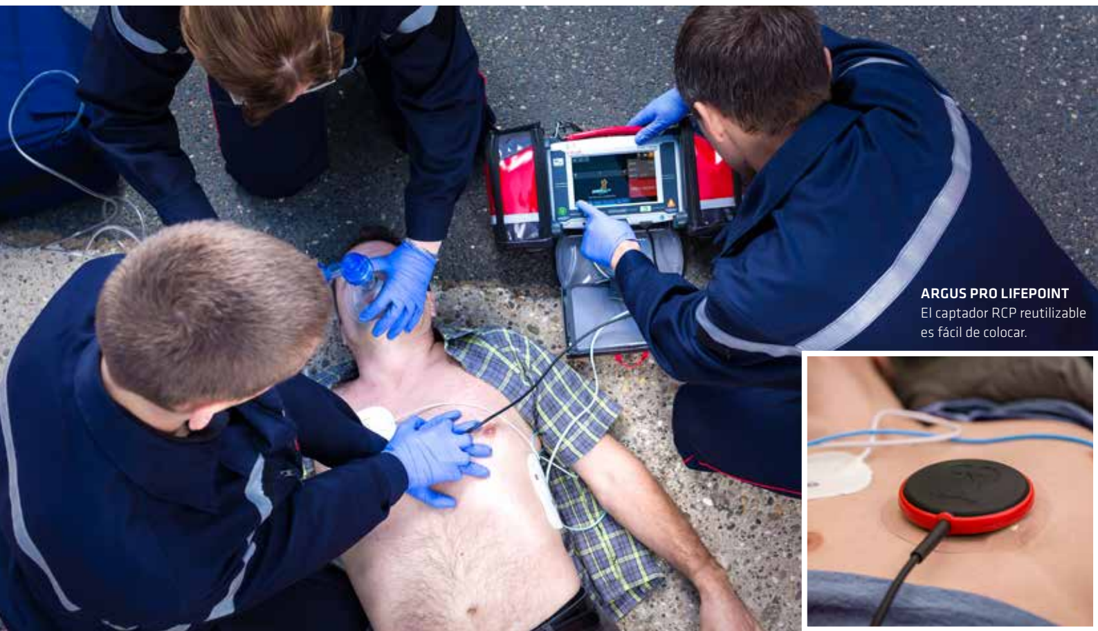
ARGUS PRO LIFEPOINT El captador RCP reutilizable es fácil de colocar.