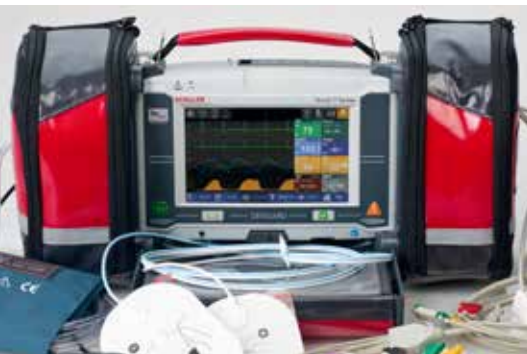
DEFIGARD TOUCH 7 MONITOR / DESFIBRILADOR

DEFIGARD Touch 7 y PHYSIOGARD Touch 7 (DGT7/PGT7) son herramientas indispensables para el personal responsable de primeros auxilios. Tanto en la versión de desfibrilador/monitor como en la de monitor solamente, el dispositivo es extremadamente compacto y ofrece la tecnología de desfibrilación más avanzada junto con amplias funciones de monitorización. Es el primer desfibrilador/monitor de emergencia dotado de pantalla táctil, característica que lo convierte en el equipo más fácil de usar del mercado. Además incorpora soluciones de transmisión de datos ultramodernas.